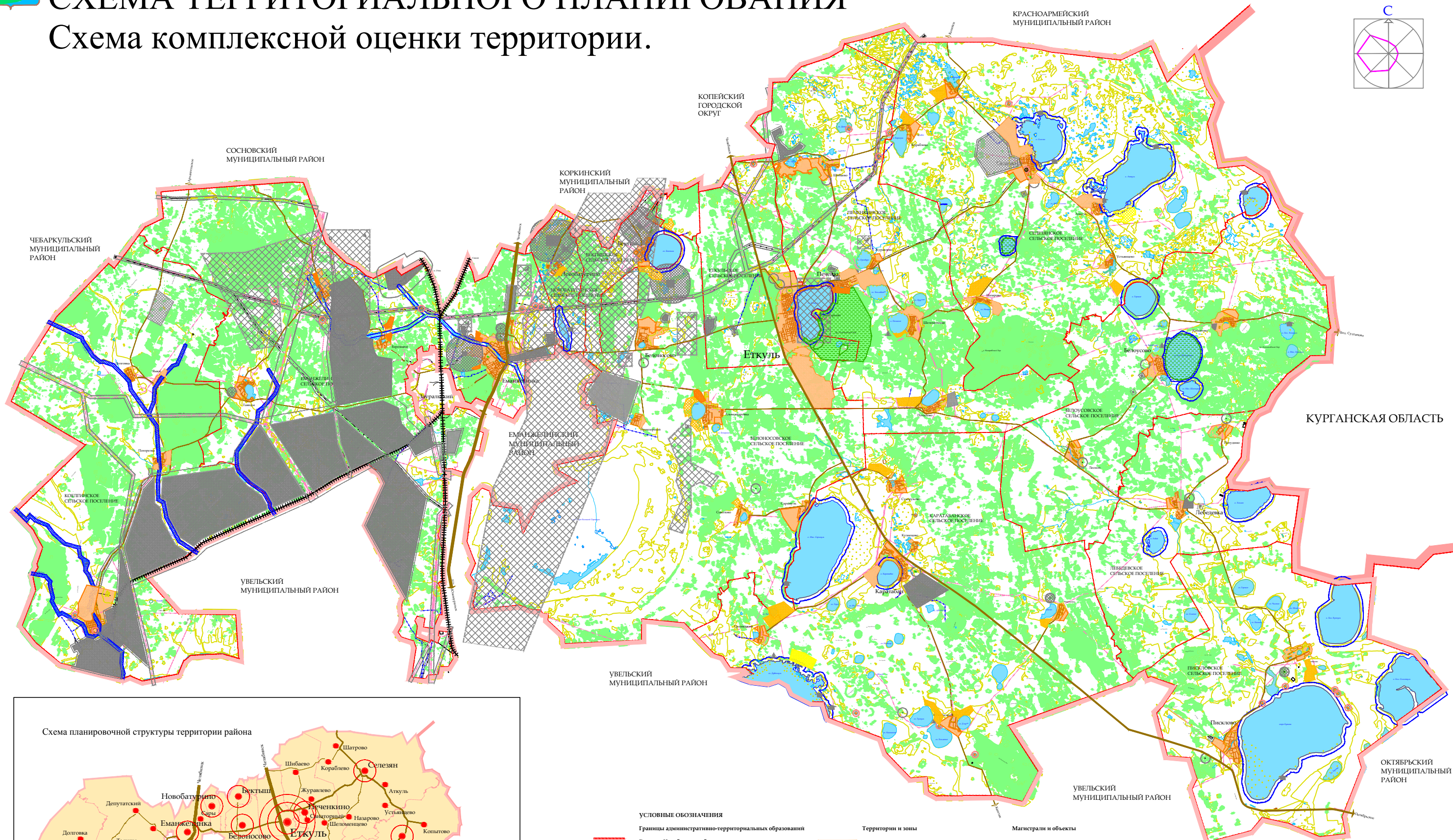
Схема планировочной структуры территории района