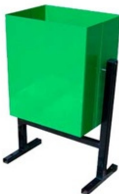
Образец № 1