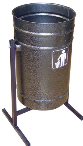
Образец № 2